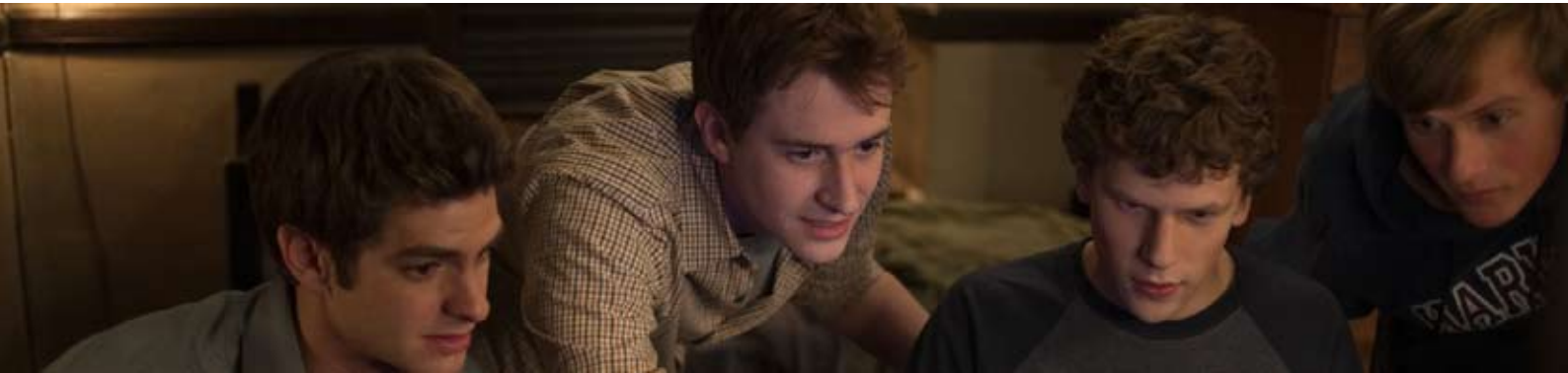
Från: The Social Network, Sony Pictures