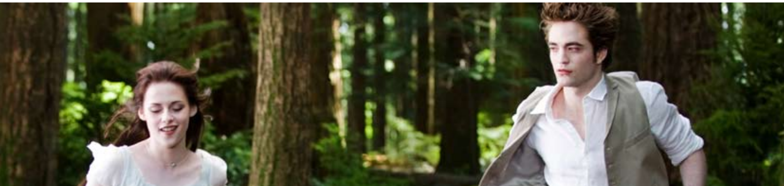
Från: New Moon , ©Nordisk film