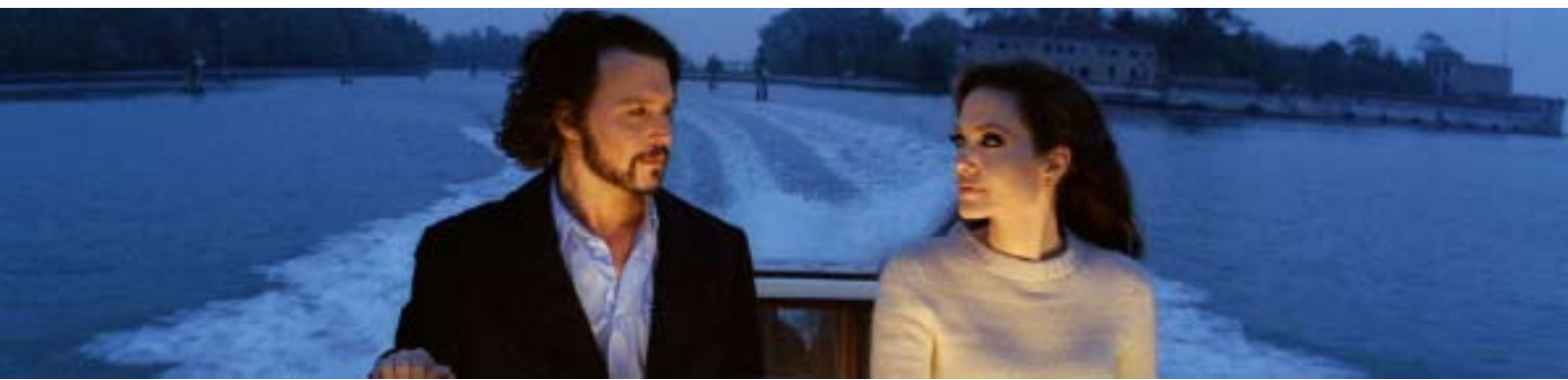
Från: The Tourist , Sony Pictures