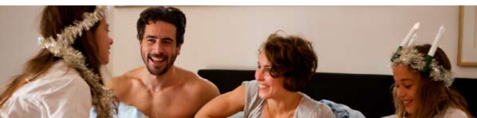
Från: Svinlängorna, ©Rolf Konow/Nordisk film