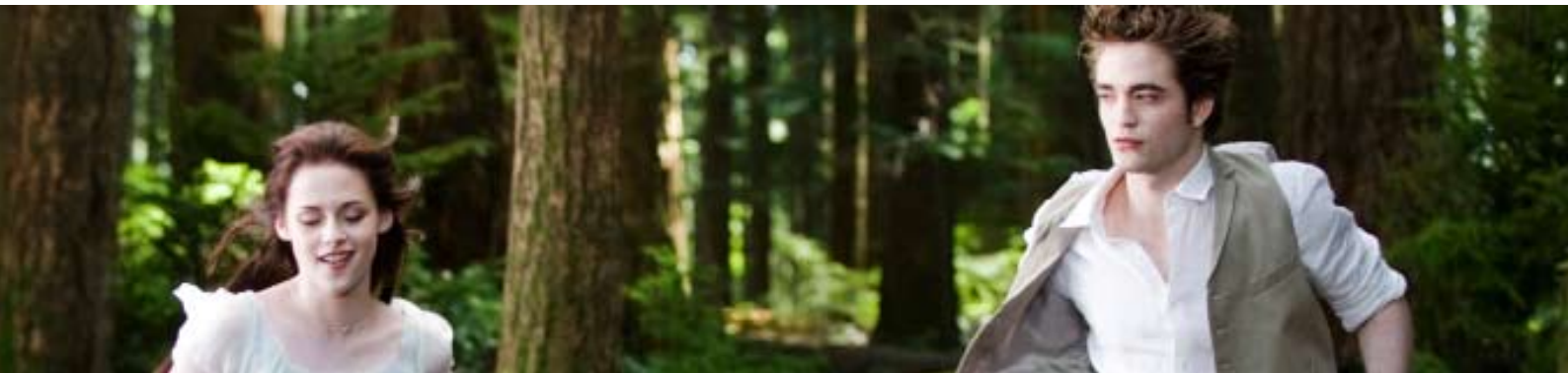
Från: New Moon , ©Nordisk film