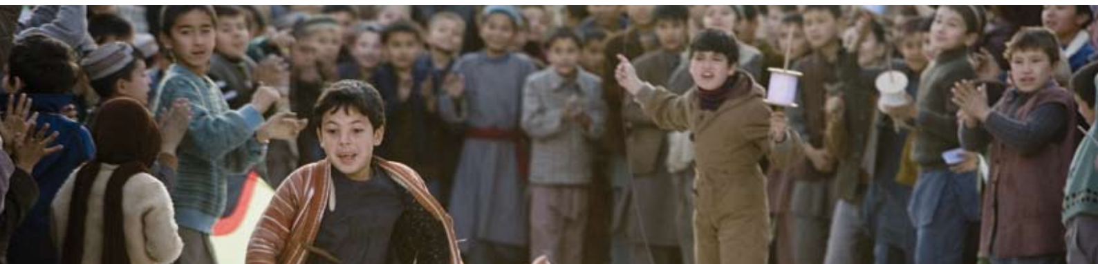
Från, Flyga drake, SandrewMetronome