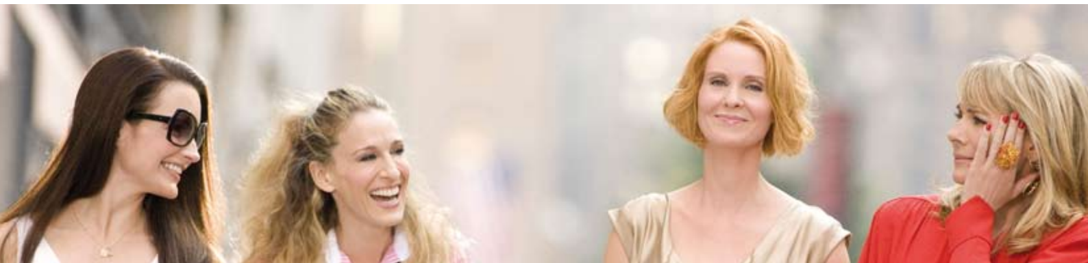
Från: Sex and the City, SF